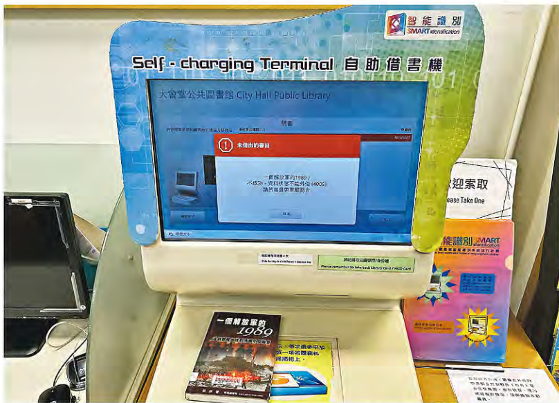
架上書籍 無法借閱 審計署上月26日發布報告建議康文署加強檢視圖書館藏維護國安，本報記者在本月初先後發現涉及字眼如「六四」或部分作者的書遭下架；記者上週三（10日）到中環大會堂圖書館觀察，《一個解放軍的1989》（圖）雖在架上，但無法借出、在網頁上無紀錄；保安員示意要將該書交予職員處理。（明報記者攝）

康文署在本月初分地下架多項與六四相關圖書或影片，包括在1990年由《聯合早報》出版的英文書Lee Kuan Yew on China and Hongkong after Tiananmen（中文版名為《李光耀看六四後的中、香港》），在4月28日仍可搜索到，至5月6日起下架；同一圖書在新加坡國家圖書館管理局網頁可搜尋到中英文版。